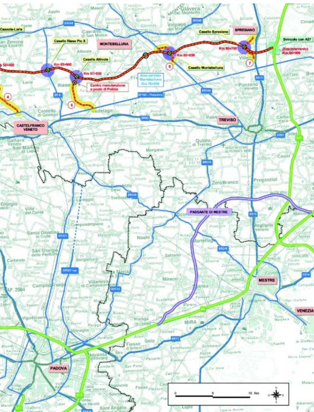
Pianta del tracciato della nuova Pedemontana veneta

Sulla base del nuovo progetto, la Pedemontana veneta dovrebbe entrare in esercizio il primo luglio 2011, sempre che la concessione venga affidata entro il 2005 e i cantieri vengano aperti nel 2006.