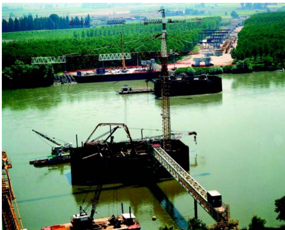
Il cantiere del nuovo ponte sul Po, con in evidenza le fondazioni delle due torri in alveo

Varo delle travi di uno dei viadotti di golena