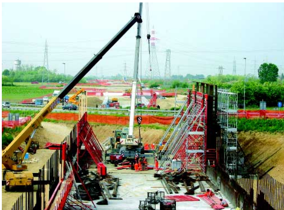
Costruzione della galleria artificiale Rondissone, nel 2003, nell'ambito dei lavori per l'Alta velocità

ridotta, e della parziale contestualità dei lavori fra le due opere (la ferrovia fino a Novara è terminata nel 2005), che oltre a fare del tratto fra Torino e Novara uno dei più grandi cantieri d'Italia, crea problemi non indifferenti di spazi, di tempi, di appalti che non a caso hanno portato a un rallentamento dei lavori per l'autostrada.