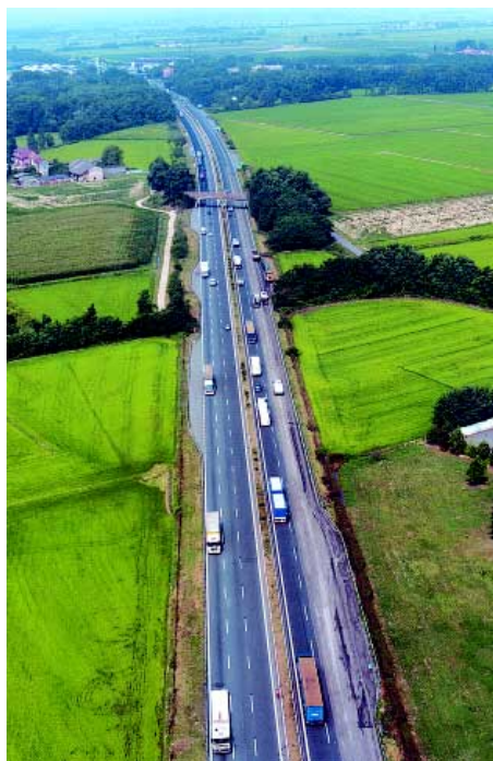
Vedute dell'autostrada Torino-Milano prima dei lavori di ampliamento

L'ammodernamento e adeguamento dei 127 chilometri dell'autostrada Torino-Milano rappresenta uno dei più importanti interventi in corso oggi in Italia, non solo e non tanto dal punto di vista economico – il Piano finanziario prevede una spesa di oltre 778 milioni di euro dal 2003 al 2014, dei quali circa 605 nel solo quinquennio 2006-2010, per metà in autofinanziamento – ma perchè si tratta della totale ricostruzione di un'infrastruttura di primaria importanza, fra le più trafficate del Paese (ha una media giornaliera di quasi 110 mila veicoli), che viene ricostruita in tutte le sue parti, dalle opere d'arte ai caselli, applicando a volte innovazioni uniche nel loro genere, dal riciclaggio a freddo delle pavimentazioni ai caselli e le aree di servizio che diventano spazi attrezzati a disposizione della clientela.