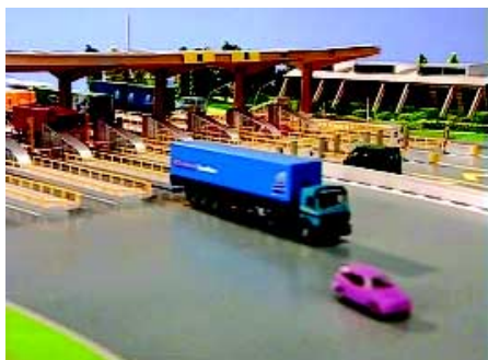
Particolare del modello delle nuove barriere della Torino-Milano

I caselli, ad esempio, sono predisposti per la totale automazione su tutte le piste, e dispongono di centri di assistenza all'utenza, con una particolare cura verso le aree di interscambio che caratterizzano la vita dell'autostrada, così che l'utente abbia spazio per fermarsi,