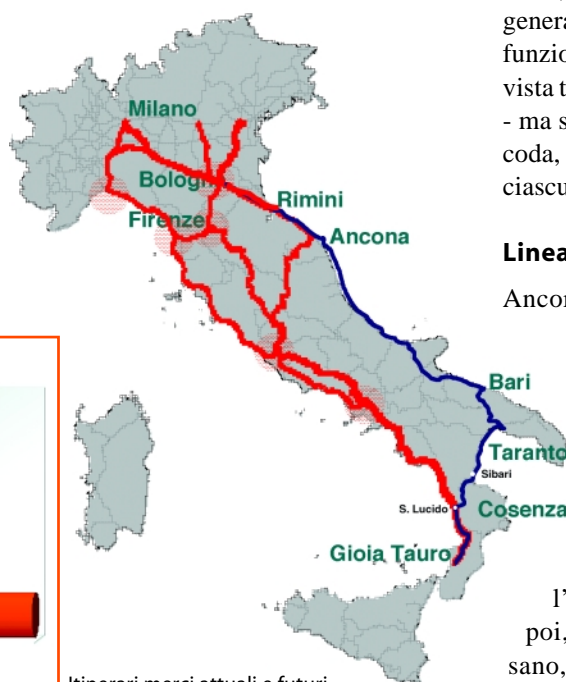
Itinerari merci attuali e futuri