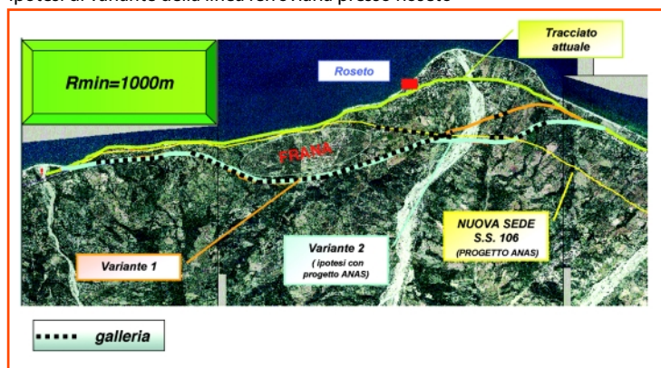
Ipotesi di variante della linea ferroviaria presso Roseto

versità degli Studi di Roma "La Sapienza", a sua volta parte integrante di un nuovo tipo di approccio di Rfi agli studi di fattibilità.