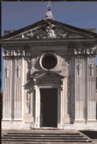
La Vera Cruz di Segovia.