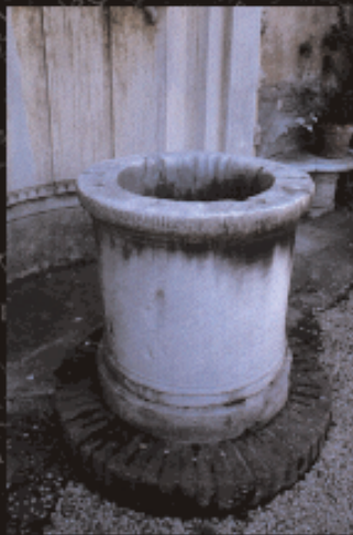
Vera da pozzo di Santa Maria del Priorato.