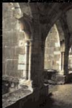
Particolare del chiostro.