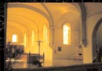
Veduta della chiesa attuale.