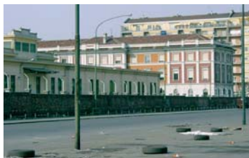
Due immagini della zona degli ex Magazzini Generali e delle Dogane.