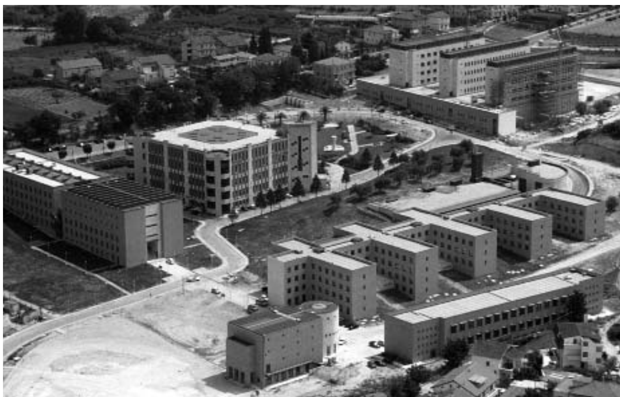
Colle dell'Ara (Chieti), nuovo presidio ospedaliero "Santissima Annunziata"

Ma le risorse statali non sono in grado di finanziarle e questo comporta, necessariamente, una mobilitazione di capitali privati per finalità pubbliche, attraverso progetti ine-