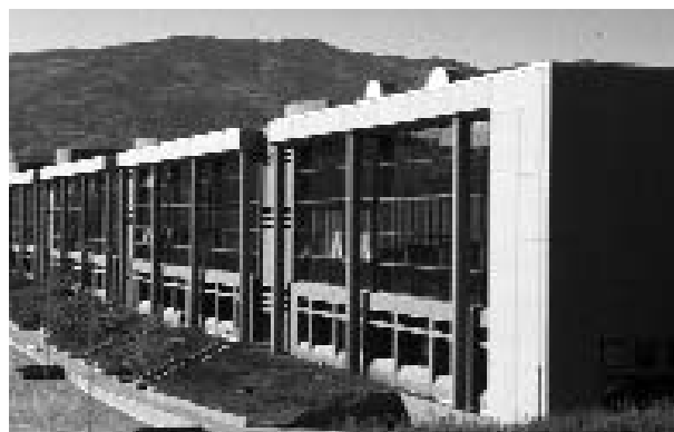
Teramo, facoltà di Giurisprudenza

Si tratta quindi di un insieme di tematiche che impone il ricorso, massiccio e inedito, alle tecniche di monitoraggio dei processi prima, durante e dopo l'intervento, per supportare adeguatamente il controllo delle azioni e dei loro effetti.