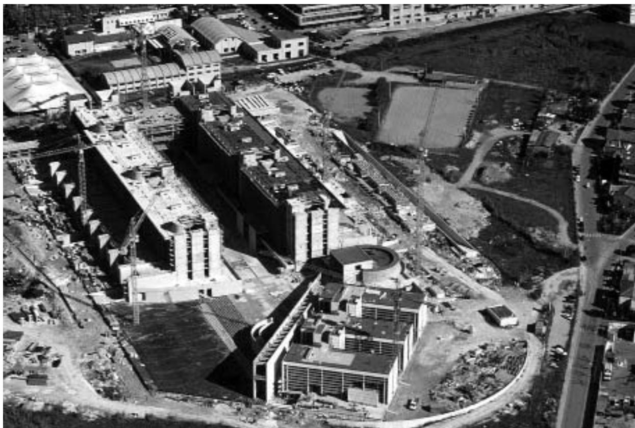
Pescara, nuova sede degli Uffici Giudiziari

La città si trasforma anche se ci si limita ai soli interventi di adeguamento e di manutenzione,