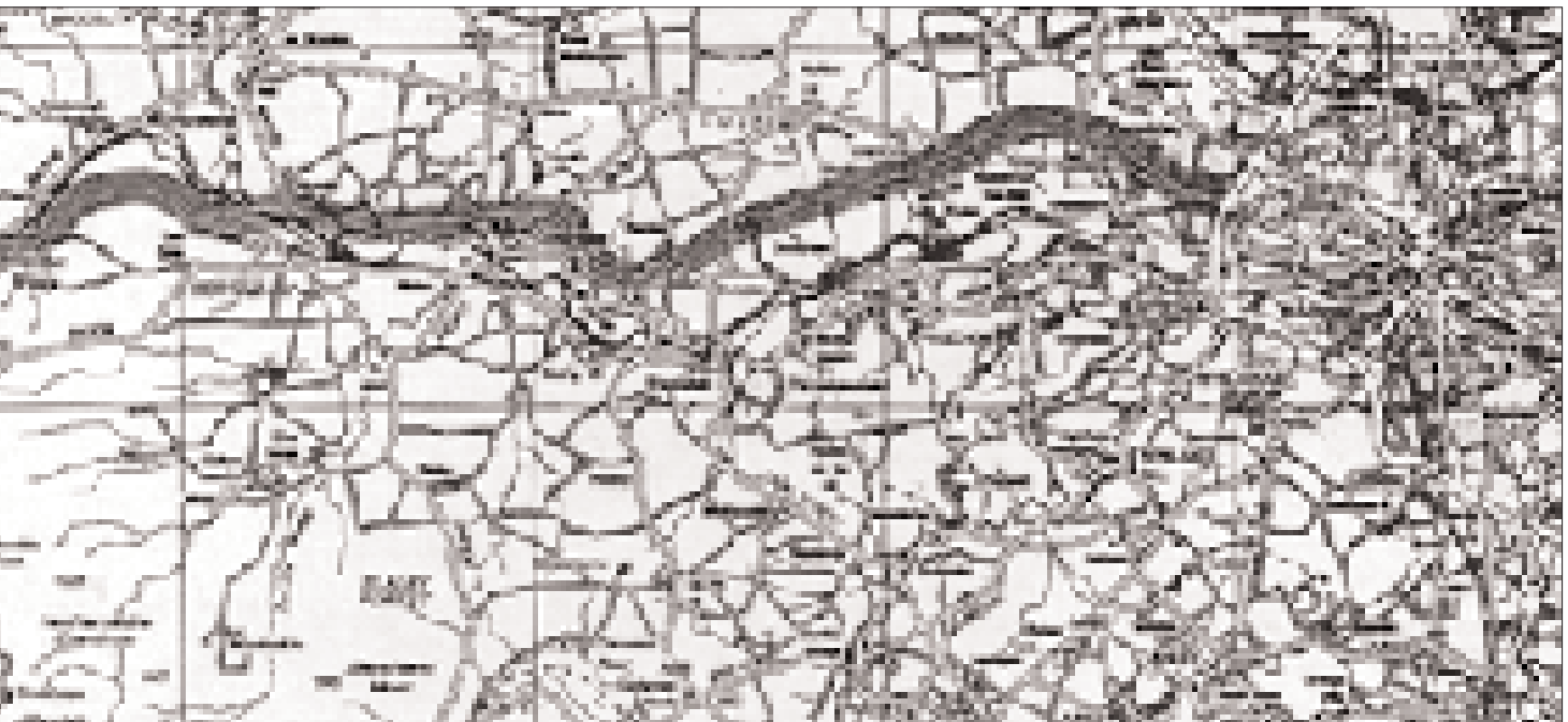
▲ In alto, pianta di inquadramento del territorio attraversato.