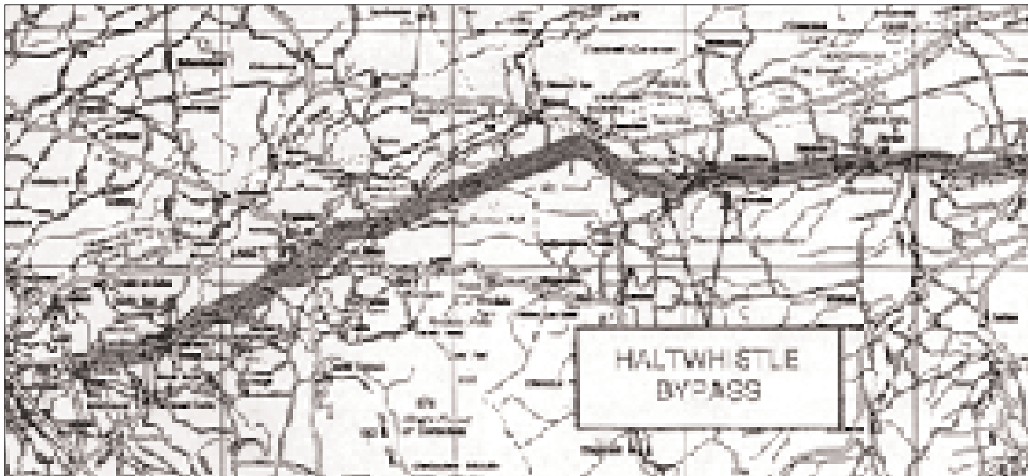
▲ Planimetria generale della A69.

Per quanto riguarda l'operatività dell'autostrada A69 a tutt'oggi si è verificato un solo incidente mortale e la Highway Agency (Ente del ministero dei Trasporti che sovrintende al controllo della costruzione e gestione delle autostrade) ha espresso per iscritto i suoi compli-