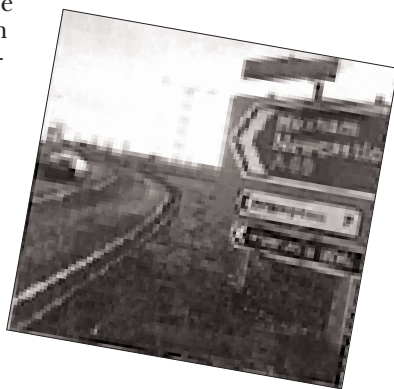
◀ Veduta dell'autostrada A69 nei pressi di Haltwhistle, con il progetto di bypass della cittadina.

Sulla A69 da tempo ci sono 13 installazioni per la rilevazione del traffico che distinguono i veicoli leggeri e i veicoli pesanti: si hanno pertanto tutti i dati per analizzare nel tempo lo sviluppo dei flussi del traffico.