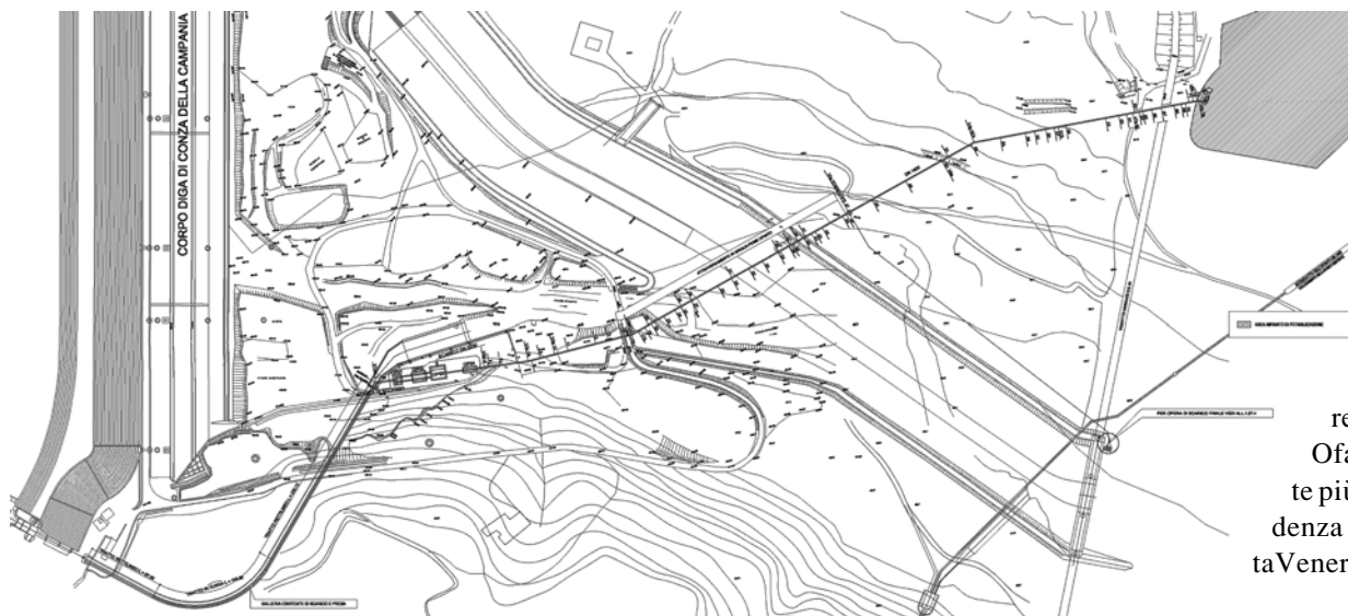
Planimetria della condotta tra l'invaso di Conza e il potabilizzatore

proveniente dall'invaso raggiunge le vasche di misurazione e partizione nelle quali avviene il controllo delle portate e la suddivisione tra le acque destinate alla potabilizzazione e quelle da inviare all'irrigazione, che vengono reimmesse nel fiume Ofanto per essere captate più a valle in corrispondenza della traversa di SantaVenera.