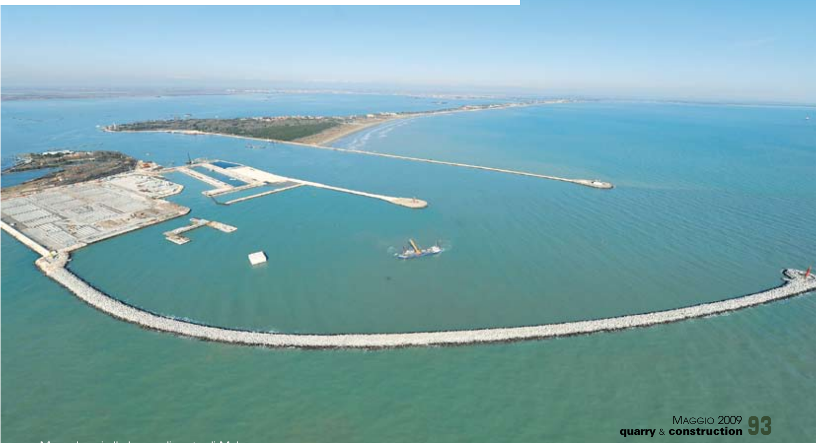
Mose, lavori alla bocca di porto di Malamocco

N el marzo scorso il Governo, attraverso il Cipe, ha approvato un Piano di opere infrastrutturali da 16,6 miliardi di euro, compiendo un primo, concreto passo verso l'attuazione della terza fase del processo di reinfrastrutturazione del Paese, quello avviato nel 2001 con la Legge Obiettivo e il primo Piano decennale delle infrastrutture strategiche. Questa terza fase prende corpo nel luglio 2008, con l'approvazione dell'Allegato Infrastrutture al Documento di