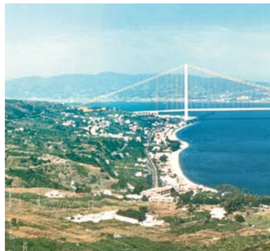
Progetto del ponte di Messina

Poi però c'è stato il terremoto in Abruzzo,