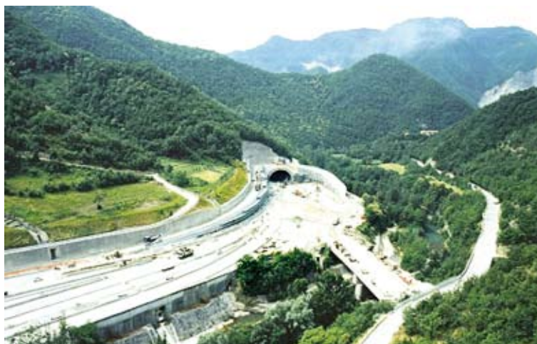
Area San Pellegrino della Bologna-Firenze

Quanto alle opere inserite al volo, grazie alla capacità programmatoria e alla bravura di chi ha istruito le pratiche e sviluppato la progettazione – portando quindi all'attenzione del Cipe progetti concretamente cantierabili – spicca la Regione Campania, che ogni anno riesce a farsi finanziare interventi in tutti i settori: questa volta li ottiene per l'adeguamento della Statale Telesina (Caia-