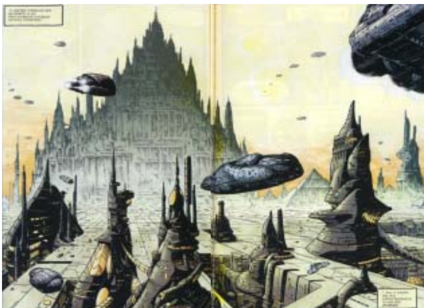
Ralph McQuarrie, veduta di Imperial City, con grandi piramidi che emergono da un tessuto urbano compatto, 1977, illustrazione a colori, in "The art of Star Wars galaxy: volume 2", Topps publishing, 1994.