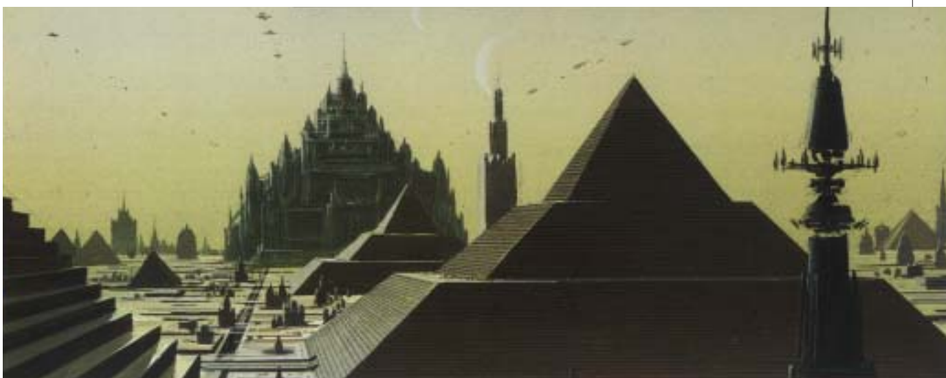
Carlos Ezquerra, veduta del centro di Imperial City, quattro anni dopo l'Episodio VI, 1998, tavola a colori per l'albo "Mara Jade, Il braccio dell'imperatore", Magic Press, Star Wars n. 14, giugno/luglio 2001.