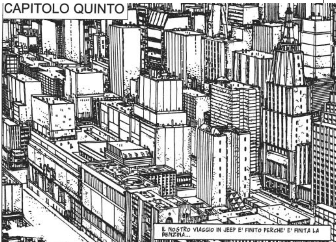
Juan Gimenez, particolare e panoramica del tessuto urbano di torri e grattacieli di una città infinita, 1995, tavola b/n per "La città", parte 1, Fantacomix-day, Eura Editoriale, giugno 1997.

CAMMINIAMO GIÀ DA UN'ORA PER LE STRADE DESERTE DEL NUOVO QUARTIERE. A UN TRATTO IL CIELO SI FA NERO. MIGLIAIA DI LAMPI DANNO INIZIO A UNA SPAVENTOSA TEMPESTA MAGNETICA.