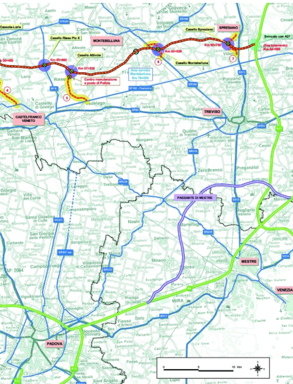
Pianta del tracciato della nuova Pedemontana veneta

Sulla base del nuovo progetto, la Pedemontana veneta dovrebbe entrare in esercizio il primo luglio 2011, sempre che la concessione venga affidata entro il 2005 e i cantieri vengano aperti nel 2006.