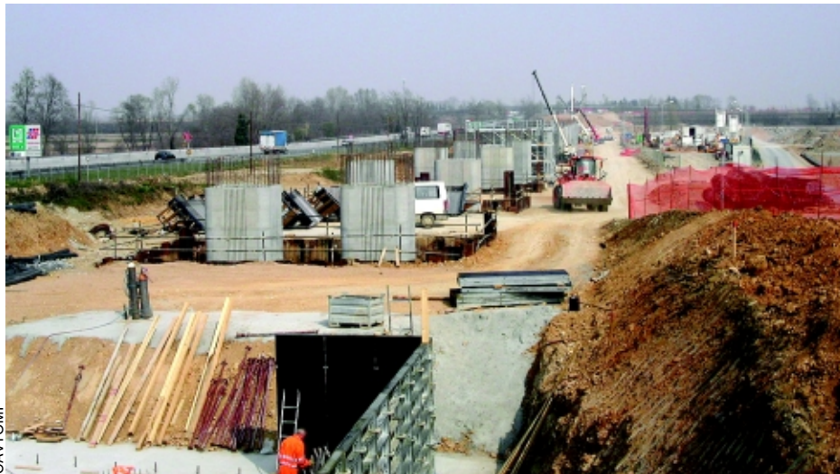
Particolare dei cantieri dell'AV Torino-Novara e della vicina autostrada

Allo stesso tempo viene mantenuto il servizio di trasporto pubblico autostradale, che ha fermate in tutti i caselli - una caratteristica specifica di questa autostrada - e per il quale saranno riorganizzate sia le fermate che i parcheggi di interscambio.