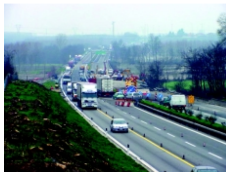
Veduta dell'autostrada Torino-Milano e modello delle nuove barriere