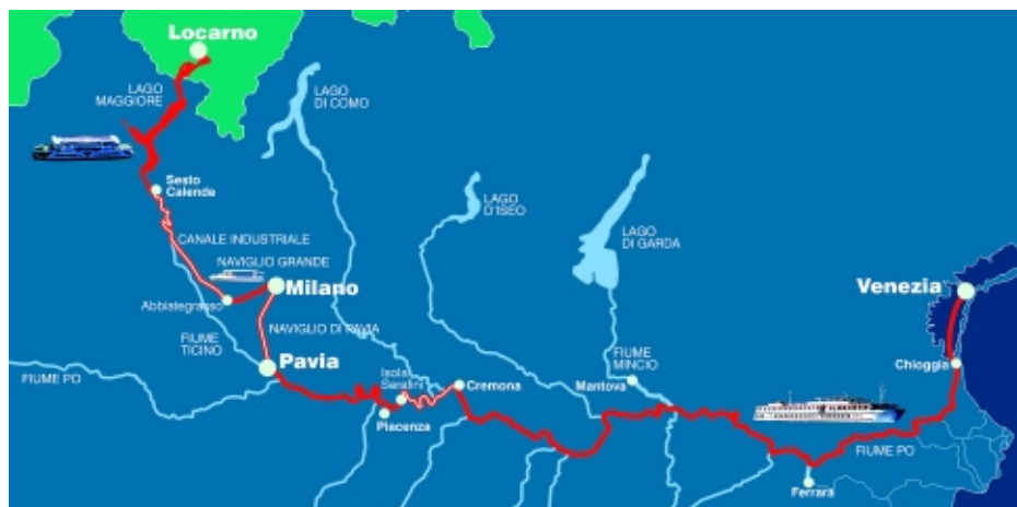
Schema dell'itinerario fluviale Locarno-Venezia con evidenziati i tratti oggi non navigabili