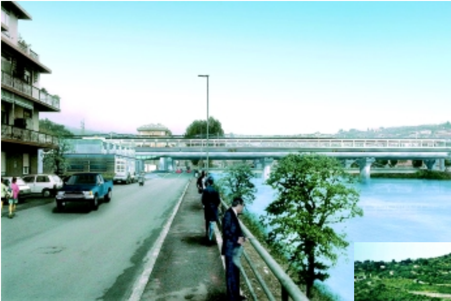
Veduta del progetto per la nuova stazione di Imperia, prevista sul Torrente Impero

Infine, il Terzo Valico dei Giovi, punto nevralgico della nuova linea AV affidata al General Contractor Cociv (54 chilometri di cui 39 in galleria) che dovrebbe potenziare i collegamenti fra il sistema portuale ligure-tirrenico e il bacino padano e i porti del nord Europa, oltre a contribuire al miglioramento del sistema metropolitano genovese. Il 29 settembre 2003 il Cipe ha approvato il Progetto preliminare e lo Studio di impatto ambientale, e ha finanziato le opere propedeutiche con 319 milioni di euro (su un investimento complessivo valutato in circa 4,2 miliardi di euro, di cui