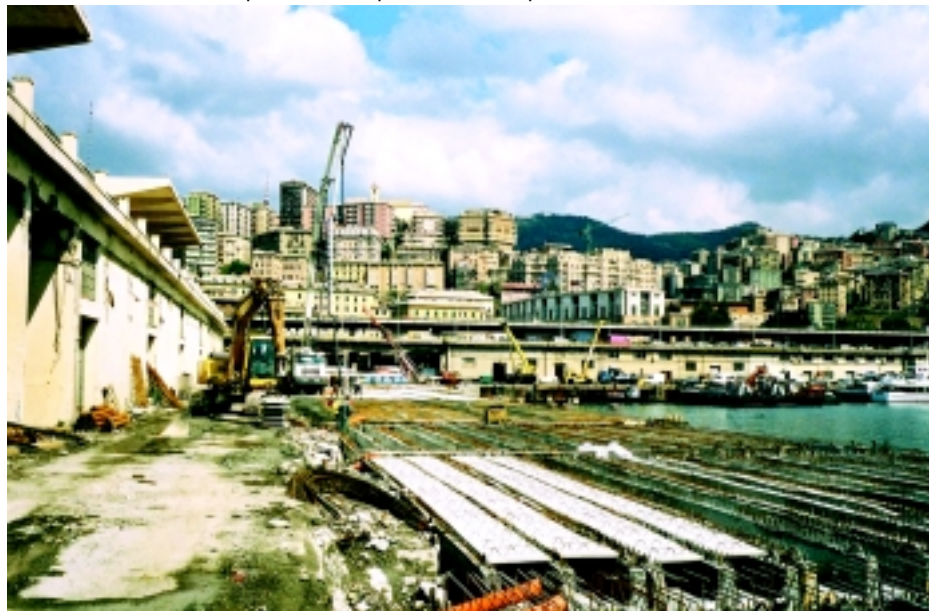
Particolare dei lavori di ampliamento del ponte Doria, nel porto di Genova

Infine, per l'hub di La Spezia, i progetti preliminari dell'Autorità Portuale riguardano l'ampliamento e l'adeguamento della capacità dei parcheggi per i mezzi pesanti e la realizzazione di servizi idonei per i conducenti, e un nuovo svincolo sull'asse autostradale Forno-la-La Spezia.