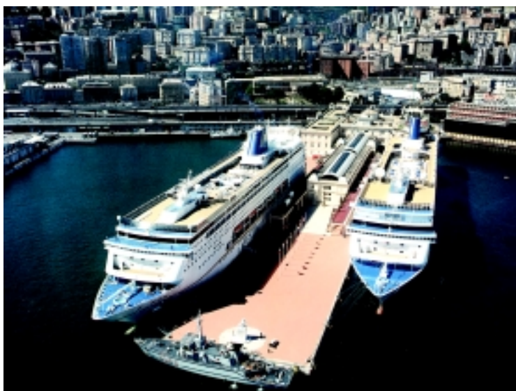
Vista della stazione marittima di Genova durante il G8

Qui sono in corso o previsti investimenti legati a valenze trasportistiche e commerciali proprie, per un totale di almeno 2 miliardi di euro; investimenti specifici - 7.443 mila euro dalla Regione Liguria (pari al 65 per cento del