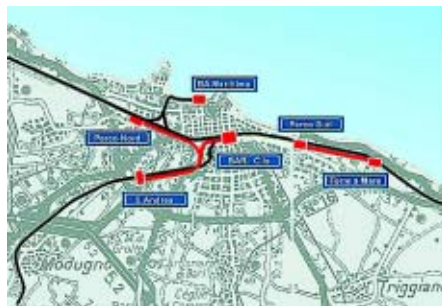
Schemi, elaborati da Rfi, dei lavori in corso o previsti nel nodo ferroviario di Bari

Barletta fino a Monopoli, con un sistema di relazioni infrastrutturali, economiche, produttive e