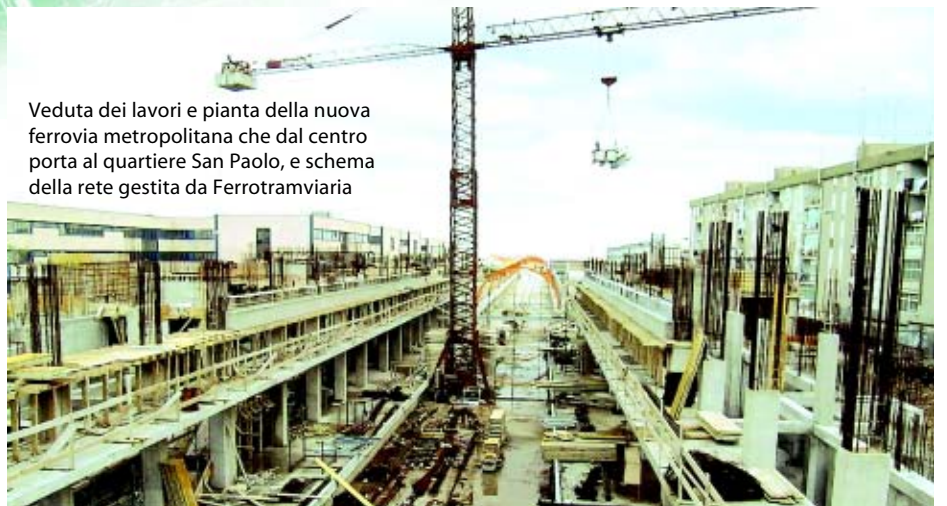
Veduta dei lavori e pianta della nuova ferrovia metropolitana che dal centro porta al quartiere San Paolo, e schema della rete gestita da Ferrotramviaria

circa 9,3 chilometri, con quattro fermate, per un costo di circa 70 milioni di euro – attualmente in avanzata fase di realizzazione (ampiamente descritto in un articolo di Raffaella Chierici sul numero di febbraio 2005 di Quarry and Construction), perchè si tratta del primo servizio di tipo metropolitano di Bari – nasce con una logica ferroviaria ma ha mezzi e incrociamenti tipici da metropolitana – ed è concepito come strumento di riqualificazione e rinnovo urbano, in uno dei più complessi e degradati quartieri della città. La linea, che ha aperto i cantieri nel 2000,