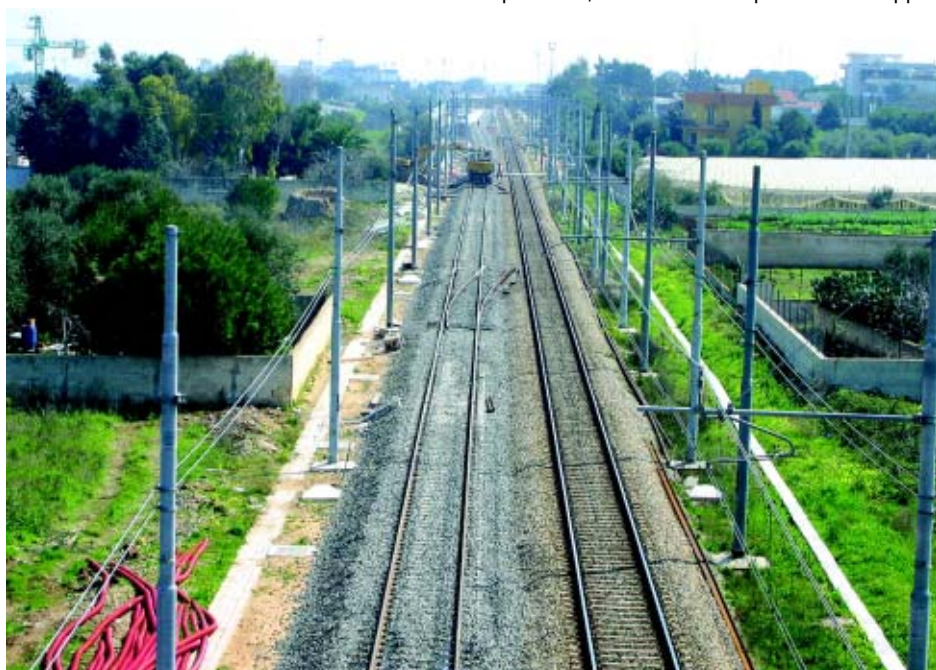
Veduta della linea Rfi per Lecce, dove è stato completato il raddoppio