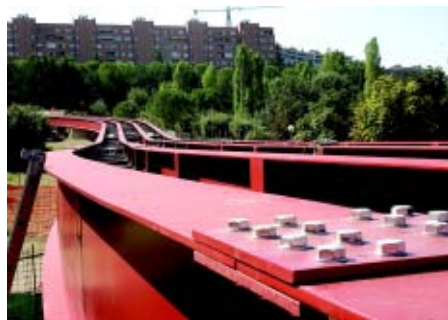
Particolare del viadotto del primo tratto del minimetrò di Perugia

prevede di estendersi per un altro chilometro verso la periferia est, a Montelucente, si articola in sette fermate e tre gallerie, e utilizza un sistema a fune sviluppato dalla Leitner di Vipiteno che rappresenta un elemento di novità nel panorama trasportistico italiano, così come lo è, in parte, il tipo di finanziamento e di gestione del progetto adottato dal Comune di Perugia.