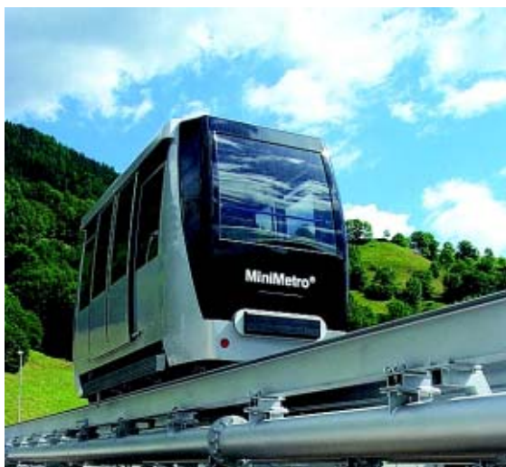
Esempio della vettura del minimetrò di Perugia

Poi l'esempio di Perugia è stato seguito da diverse altre città in posizioni orografiche complesse, come Orvieto, dove il progetto di recupero e consolidamento