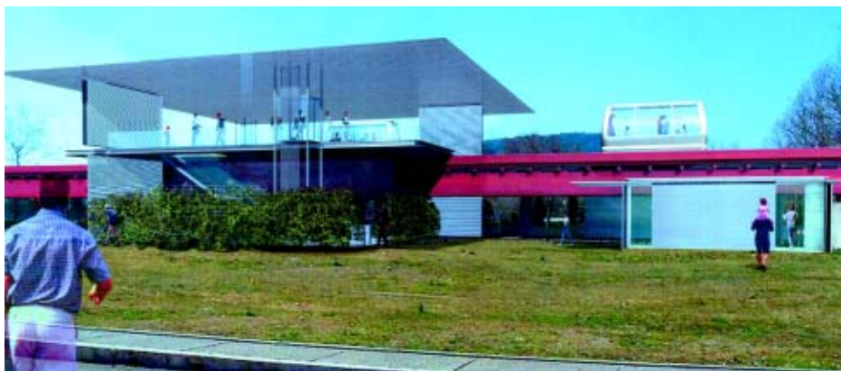
Simulazione di una delle stazioni del minimeetro di Perugia disegnate da Jean Nouvel

del progetto del secondo tratto, verso Montelucente.