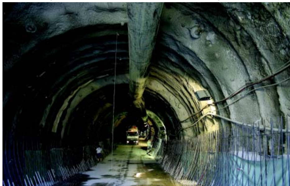
Particolare della galleria del minimeetro scavata sotto il centro storico di Perugia

Quanto alla seconda tratta, la cui progettazione definitiva è terminata, il Comune di Perugia parteciperà al Bando del ministero delle Infrastrutture e dei trasporti per l'accesso ai finanziamenti pubblici.