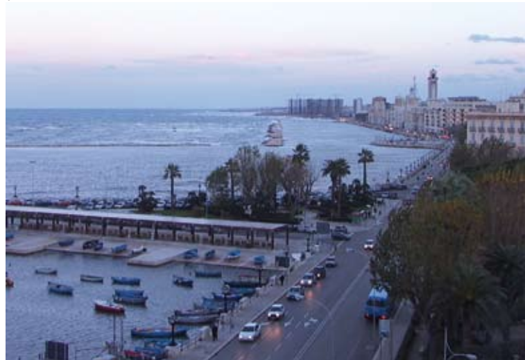
Veduta del lungomare di Bari con, sullo sfondo, i palazzi di punta Perotti prima della demolizione